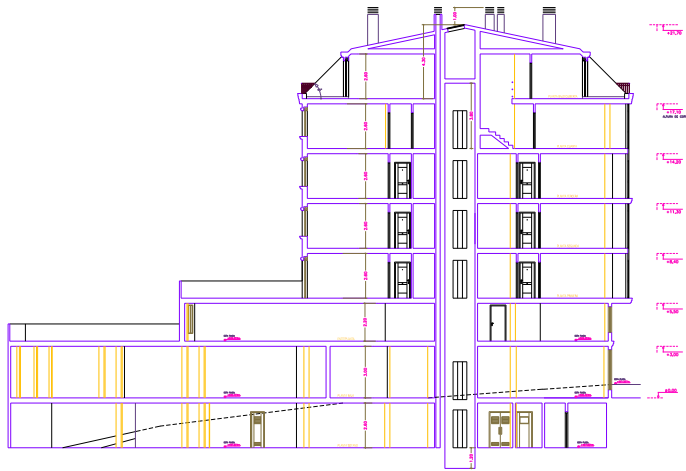
Seccion B-B Escala 1/100